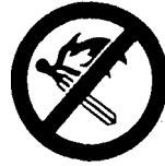
Flamme nue interdite et défense de fumer