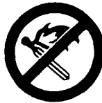
No naked flames and no smoking