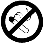
Défense de fumer