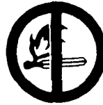
Brug af åben ild og rygning forbudt