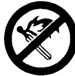
Proibido fazer lume e proibido fumar