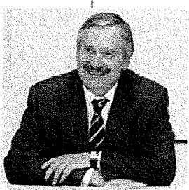
M. Sîm Kallas Vice-Président de la Commission